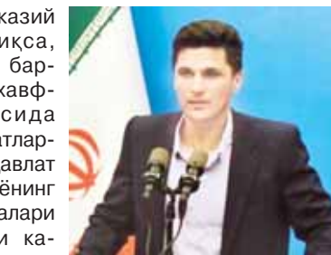
Ўзбекистон ва Россия ўртасидаги саммитда иштирокчилар.

Икки давлат ўртасидаги ҳамкорлик қўллаб соҳаларда, жумладан, энергетика, аэрокосмик,