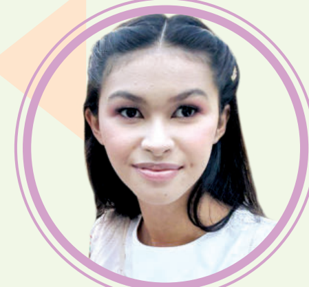
имкониятларингизни синаб кўришдан, бу йўлда хато қилиш ва улардан сабоқ олишдан

Президентимизнинг битирувчиларга табригини иштиёқ билан тингладик. Давлатимиз раҳбари "Ҳеч қачон орзу қилишдан тўхтаманг, катта мақсадлар йўлида