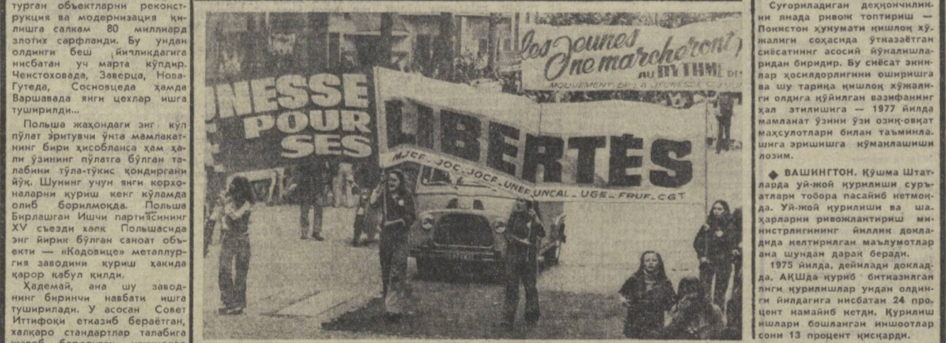
Француз ёшларнинг манифестацияси «Франция ёшлари ўз эвадиги учун курашадилар!» ширини остида ўтиб, Коммунистик ёшлар ҳаракати ва бошқа ёшлар ташкилотларининг ташаббуси билан ўтказилган ва манифестацияда ёшларнинг хилма-хил қатламлари қатнашди.