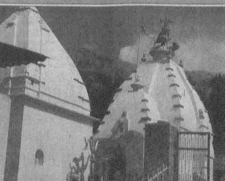
ҚАДИМИЙ Ҳиндистонда эътиборга сазовор жойлар қўп. Судх Маҳадев ибодатхонаси ҳам ана шундай асори-атиқалардан бири ҳисобланади.

РОССИЯ Федерацияси Давлат Думаси Югославия Россия ва Беларусь Иттифоқида қўшилган тўғрисидаги қарор лойиҳасини асос учун қабул қилди. Бу мақомни ёқлаб, 326 нафар депутат овоз берди. 46 киши қарши чиқди.