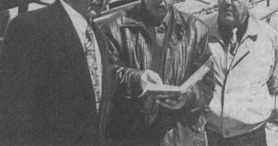
Корхона иилиги икки юз минг тонна гилмоа ишлаб чиқариш қувватига эга.

Шундай қилиб, Ўзбекистон Олмония «Каолин» қўшма корхонаси маҳсулот бера бошлади.