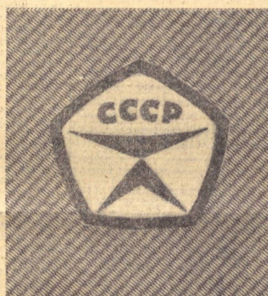
БУЮМЛАРИНИНГ 240 ХИЛИ ДАВЛАТ СИФАТ БЕЛГИСИ АТТЕСТАЦИЯСИДАН УТҚАЗИЛАДИ.