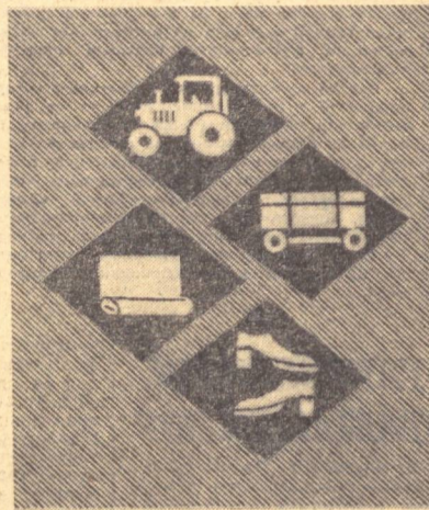
ПЛАНДАН ТАШҚАРИ 500 МИЛЛИОН СЎМЛИК МАҚСУЛОТ ТАЙЕРЛАНАДИ;