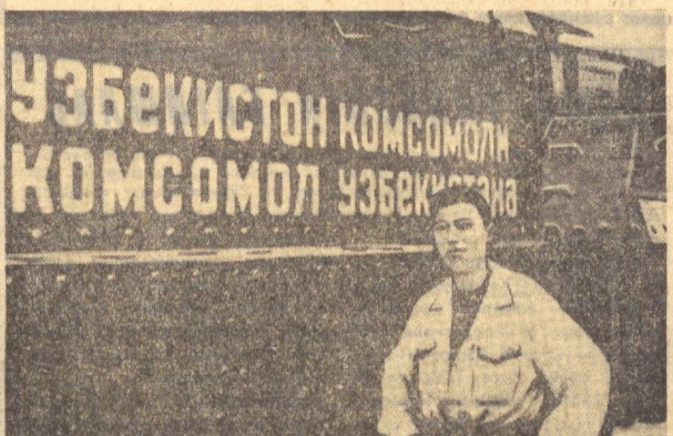
Уруш йиллари республикамиз ёшлари фронт учун ўз жамғарма пулларни ҳисобига кўллаб танклар, самолётлар куриб беришди. Суратда: навбатдаги жанговар танк Ватан ҳимоясига йўл олмоқда. (1942 йил).

(КПСС Марказий Комитетининг «Совет халқининг 1941—1945 йилларидаги Улуғ Ватан урушида қозонган Галабасининг 30 йиллиги тўғрисида»ги қароридан).