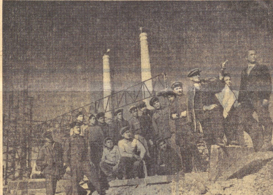
Гитлерчилар Германиясига қарши оғир уруш йилларида ҳам мамлакатимизда сунбдорлик ишлари давом эттириди, электр станциялар, завод ва фабрикалар қурилади. Бекноб металлургия комбинати наби улкан корхона ҳам ўша суронли йилларда қад кўтарди. Суратда: ёшлар металлургия комбинати қурилишига келишди.

О. ҲАКИМОВ, «Совет Ўзбекистони» муҳбири.