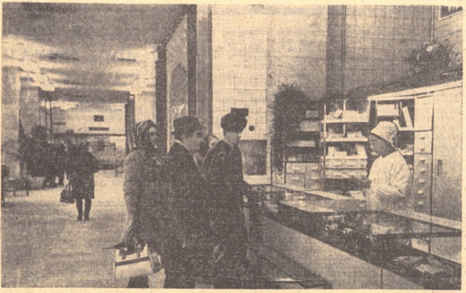
ТОШКЕНТ. Ленин номида проделан марказий дорихона биноси тузилиб ишга туширилди.