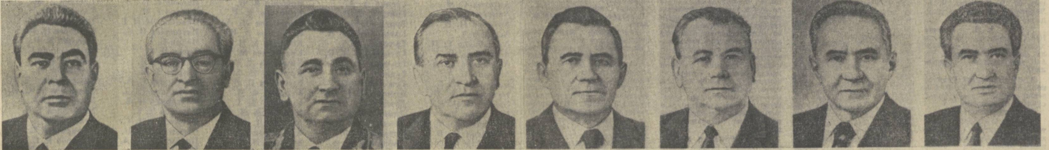
Л. И. БРЕЖНЕВ, Ю. В. АНДРОПОВ, А. А. ГРЕЧКО, В. В. ГРИШИН, А. А. ГРОМИКО, А. П. КИРИЛЕНКО, А. Н. КОСИГИН, Ф. Д. КУЛАКОВ. КПСС Марказий Комитети Сиёсий бюросининг аъзоси, КПСС Марказий Комитетининг Бош секретари. КПСС Марказий Комитети Сиёсий бюросининг аъзоси. КПСС Марказий Комитети Сиёсий бюросининг аъзоси. КПСС Марказий Комитети Сиёсий бюросининг аъзоси. КПСС Марказий Комитети Сиёсий бюросининг аъзоси. КПСС Марказий Комитетининг секретари. КПСС Марказий Комитети Сиёсий бюросининг аъзоси. КПСС Марказий Комитетининг секретари.