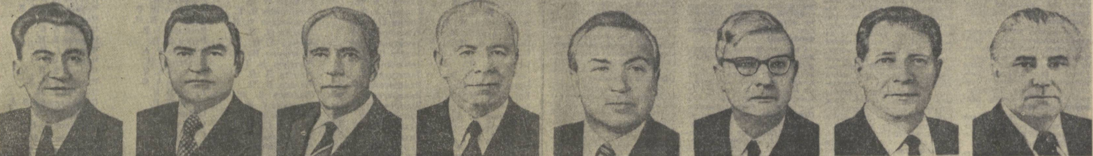
Д. А. КУНАЕВ, К. Т. МАЗУРОВ, А. Я. ПЕЛЬШЕ, Н. В. ПОДГОРНИЙ, Г. В. РОМАНОВ, М. А. СУЛОВ, Д. Ф. УСТИНОВ, В. В. ШЧЕРБИЦКИЙ. КПСС Марказий Комитети Сиёсий бюросининг аъзоси. КПСС Марказий Комитети Сиёсий бюросининг аъзоси. КПСС Марказий Комитети Сиёсий бюросининг аъзоси, КПСС Марказий Комитети ҳузуридаги партия контроли комитетининг раиси. КПСС Марказий Комитети Сиёсий бюросининг аъзоси. КПСС Марказий Комитети Сиёсий бюросининг аъзоси. КПСС Марказий Комитетининг секретари. КПСС Марказий Комитетининг секретари.