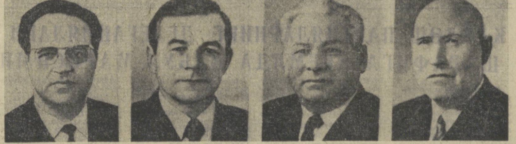
К. Ф. КАТУШЕВ, М. В. ЗИМЯНИН, К. У. ЧЕРНЕНКО, Г. Ф. СИЗОВ. КПСС Марказий Комитетининг секретари. КПСС Марказий Комитетининг секретари. КПСС Марказий Комитетининг секретари. КПСС Марказий Ревизия комиссиясининг раиси.

Қабул маросимда қардош партияларнинг вакиллари, КПСС Марказий Комитети Сиёсий бюросининг аъзолари ва аъзоллиқ кандидатлари, КПСС Марказий Комитетининг секретари, КПСС Марказий Комитетининг аъзолари ва аъзоллиқ кандидатлари, КПСС Марказий Ревизия комиссиясининг раиси. Қардош партияларнинг вакиллари, КПСС Марказий Комитети Сиёсий бюросининг аъзолари ва аъзоллиқ кандидатлари, КПСС Марказий Комитетининг секретари, КПСС Марказий Комитетининг аъзолари ва аъзоллиқ кандидатлари, КПСС Марказий Ревизия комиссиясининг раиси.