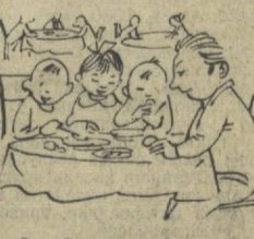
Ота болаларини ресторанга олиб келди...