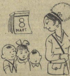
Болаларим, бугун сизларга отангиз овнат тайёрлаб бермадилар.