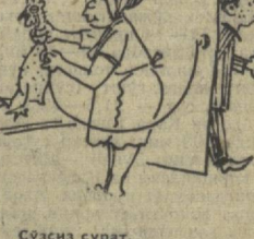
Сўзаси сурат. А. Холматов расмлари.

«Совет Ўзбекистонининг навбатдаги сонин 10 марта чикади».