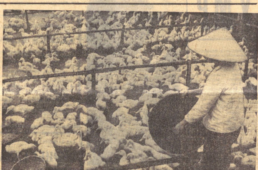
ВЬЕТНАМ ДЕМОКРАТИК РЕСПУБЛИКАСИ. Ханой яқинидаги Фап-ван паррандачилик фермаси уруғи гўшт ва туҳмун етказиб беради. Ҳужалик коллективи план топширишларини хависа ошириб адо этмоқда. Суратда: Фап-ван фермасида.

Португалия Коммунистик партияси билан насаба союзлари федерацияси — Интерсиндикат аҳолини қонуний ҳукуматни ҳимоя қилишга чақирдилар. Лиссабондаги вазият нормал сақланмоқда.