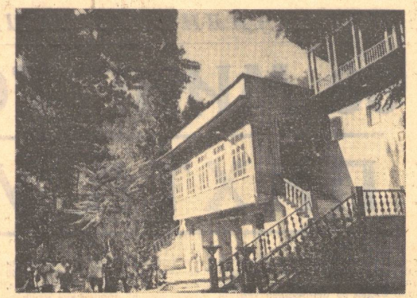
Тоғ оралиғига жойлашган «Сўқоқ» дам олиш уйи ҳам меҳнаткашларнинг севимли масканларидан. Суратда: «Сўқоқ» дам олиш уйининг бош корпуси.

Мазкур оромгоҳларда дам олиучиларга бу йилдан бошлаб яна бир қўлайлик яратилди: янги мавсумдан дам олиш уйларига оилавий бўлиб бориш мумкин бўлади. Оиланинг катта-кичиклигига қараб икки, тўрт, ҳатто ундан кўпроқ кишиларга мўлжалланган алоҳида хоналар яратилди. Хоналарнинг файли бўлишига, дид билан безатилишига эътибор берил-