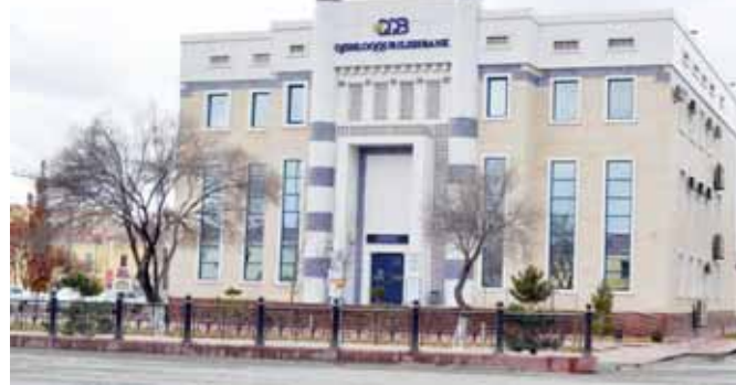
амалиётга жорий қилиш имкониятлари кенгайтириб бораётир.

Муваффақиятлар омили эса аён: "Мижоз банк учун эмас, банк мижоз учун" тамойили асосида иш юритилапти. Банк ва мижоз ўртасидаги ўзаро ишонч ҳамда ҳамкорлик мустақамлашни бормоқда. Натижада вилоят иқтисодиёти ривожига учун муҳим аҳамият касб этувчи лойиҳаларни