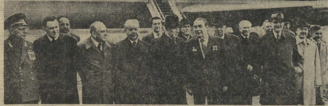
КПСС Марказий Комитетининг Бош секретари ўртоқ Л. И. Брежневни Шерметьёво аэродромда кутиб олинди.

Юровинский самийий кузатиб қолдилар. Кузатиб қолувчилар орасида КПСС Марказий Комитетининг аъъоли, СССРнинг ГДРдаги аъъоли П. А. Абрасимов, КПСС Марказий Комитети аъъолигига кандидатлар А. М. Александров, В. В. Загладин, Германиядаги совет қўнғимлари гуруҳининг бош қўмондони, армия генерали Е. Ф. Ивановский бор эдилар. Пионерлар ўртоқ Л. И. Брежневга, делегация аъъоларига туздусталар тақдим етидилар. Ўртоқ Л. И. Брежнев, делегация аъъоларини тўғилган конференцияда иштирок этган Совет Иттифоқи Коммунистик партияси делегацияси 1 июль кунги Москвага қайтиб келди. Делегацияни ташкиллаган КПСС Марказий Комитети Сийсий бюроси аъъолигига кандидат, КПСС Марказий Комитетининг секретари В. Н. Пономарев, КПСС Марказий Комитетининг секретари К. Ф. Катусев бор эди. Шерметьёво аэродромда ўртоқ Л. И. Брежнев, делегация аъъоларини В. В. Гришин, А. А. Громико,