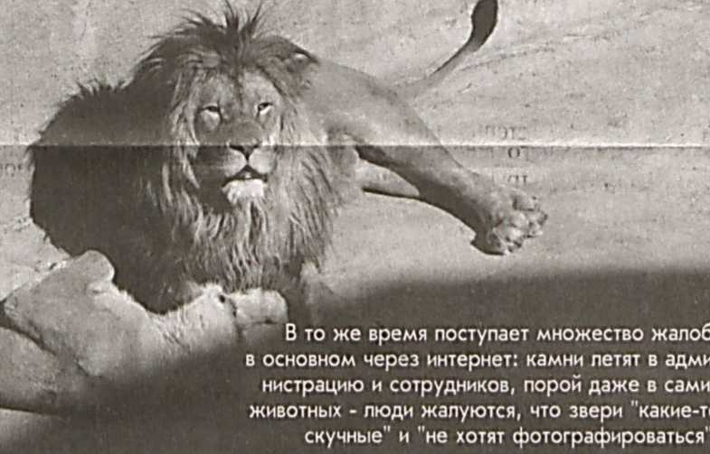
В то же время поступает множество жалоб, в основном через интернет: камни летят в администрацию и сотрудников, порой даже в самих животных - люди жалуются, что звери "как-то скучные" и "не хотят фотографироваться".