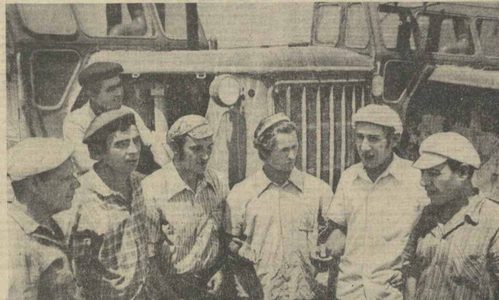
Бекор туради, дегани. Кейин яна бир ой машинанинг носоз жойларини солайсан. Биз исхтардиким, завод ўзи бажарган иш учун тула қаролат берса.

Бундай кишилар ҳақида КПСС Марказий Комитетининг Бош секретари ўрқол Л. И. Брежнев Европа коммунистик ва ишчи партиялари конференциясида сузлаган нутқида «Айтайлик, биздаги малкакали,