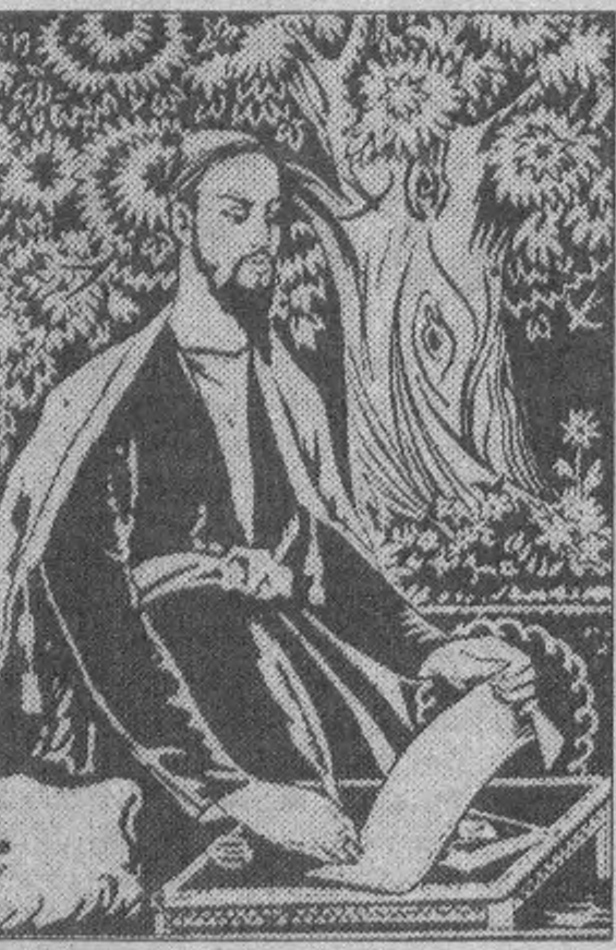
манд бўлган десак, тўғри бўлади.

Ажиниёзнинг шеърларида балкиб турган Ватан мавзуси арман шоири Хачатур Абовянининг «Арманистон жароҳатлари», ўзбек шоири Фурқатнинг хижрат газаллари, қозок шоири Махамбетнинг эл гамини куйлаган «Қизғиш қўшим» каби шеърлари билан ҳамоҳанг жаранглайди. Зеро, Ватанини улуғлаш, уни севиб, Ажиниёз шеърятининг ўз илдизи десак тўғри бўлади.