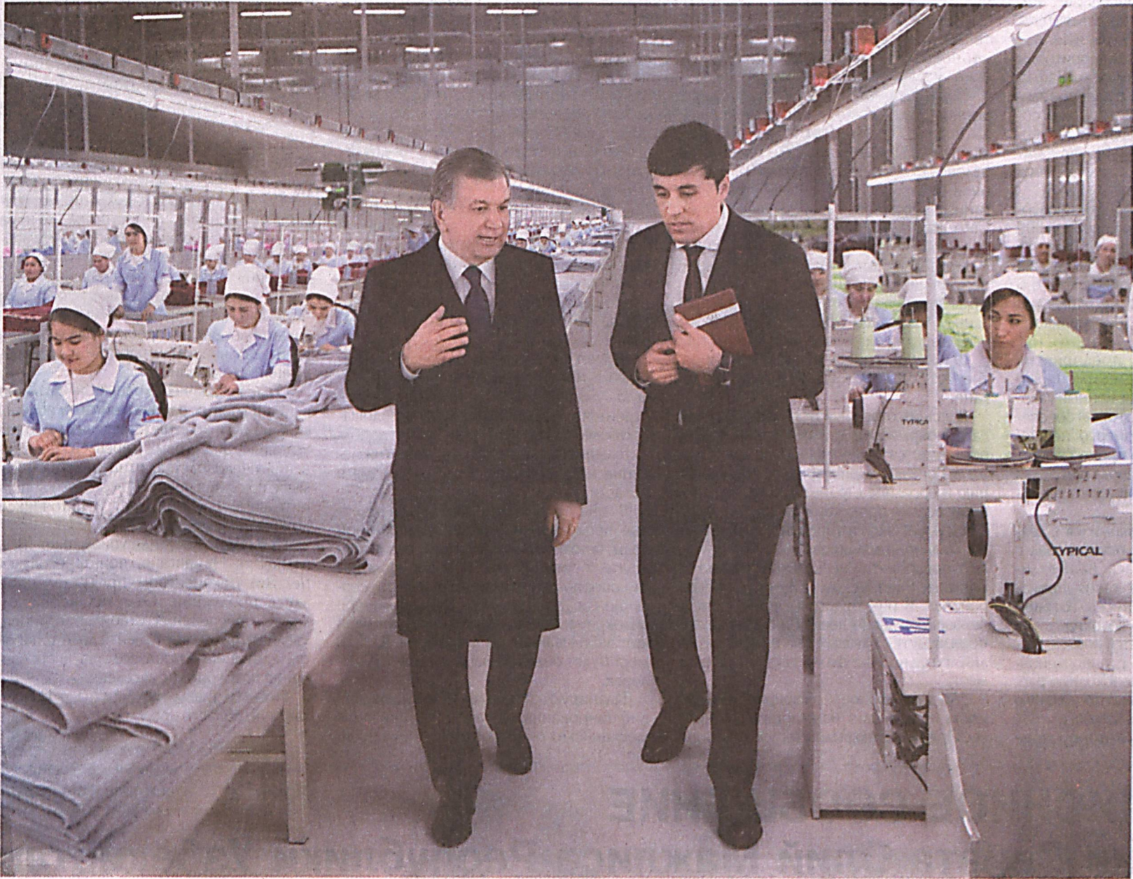
Президент Республики Узбекистан Шавкат Мирзиёев для ознакомления с ходом осуществляемой созидательной работы и крупными проектами на местах, а также диалога с народом 28 февраля прибыл в Наманганскую область.

В области проделана весомая работа по исполнению поручений, данных главой нашего государства в ходе предыдущей поездки 2-3 мая 2018 года. Особое внимание было уделено последовательному развитию промышленности, транспорта, сельского хозяйства, сфере оказания услуг и другим, строительству жилья, повышению уровня жизни населения в целом.