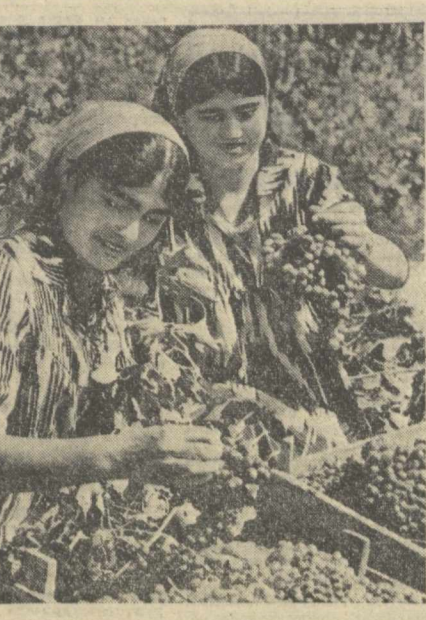
БУХОРО ОБЛАСТИ. Свердлов районидagi Свердлов номи колхоз кўпжа кишлоқ хўжалик махсулотларини Сибирь, Урал ва Запаларье меҳнатқиларига жўнатишга тайёрламоқдалар. О. ЖУМАНАЗАРОВ, «Совет Ўзбекистони» мухбири.

асосий вақти далада ўтган ҳозирги кунларда кинотоб тарқатишнинг бу формаси янада мўҳимроқ аҳамият касб этди. Ҳозир ноқ, муҳимроқ ва совхозлардаги кўча кутубхоналарда юздан ортиқ бадий кинотоб ҳамда вақтин матбуот органлари бор. Буларга қўшимча сисий, кишлоқ хўжалиқга оид брошюралар киритилган. Янгида бу борада ўтказилган област кўригида Задарё району кўча кутубхоналари биринчи ўринни эгаллади. Районнинг биргина Меҳнат Қизил Байроқ ордени «Гигант» колхоз мавжуд 19 бригадасининг ҳаммасида кўча кутубхоналар шайлаштирилди. Колхозчилар кўча кутубхоналардан фақат хоҳлаган китобларини олибгина қолмай, унинг ички бўлиги бадий-сисий ва илгиримой адабиётларга буюртмалар ҳам бериладилар.