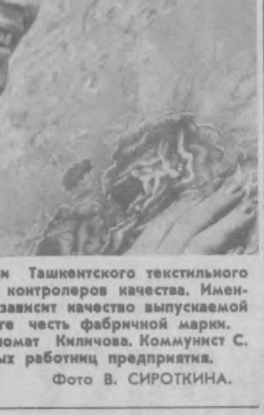
В отделе готовой продукции Ташкентского текстильного комбината работает коллектив контролеров качества. Именно от их последнего слова и зависит качество выпускаемой продукции и в конечном итоге честь фабричной марки.

Стремительно растет количество личных автомобилей. Их ремонт и техническим обслуживанием призвано заниматься объединение «Автотехобслуживание». В прошлой пятнадцатой по объему оказываемых объединением услуг по сравнению с десятой увеличился почти вдвое, выполнено свыше 2,700 тысяч заказов. Однако острота проблемы не снижается. Мощности авторемонтных станций, как нужно удовлетворяться едва на 60 процентов. А дефицит, как свидетельствует горькая практика, — питательная среда для всякого рода негативных явлений. Комплексная программа развития производства товаров народного потребления и сферы услуг поставила перед ремонтными службами задачу: «к концу десятилетия пятнадцатой в основном удовлетворить потребности населения в авторемонте». Указаны и конкретные пути решения задачи. В Узбекистане, в частности, предстоит ввести в эксплуатацию 17 станций авторемонтного обслуживания, комплектно поставленных из ПНР. Особенности их — не только полная оснащение высокопроизводительным оборудованием. Станции оборудуются со всеми необходимыми стройдетальными, включая металлические колонны, ленточный конвейер, кафель, предметы сантехники. На месте надо возвести только фундаменты, проложить водопровод, канализацию, электроснабжение, подъездные дороги. Через шестьдесят месяцев с начала строительства могут быть открыты. Но так может и не быть, если к их сооружению отнесутся как к той, которую