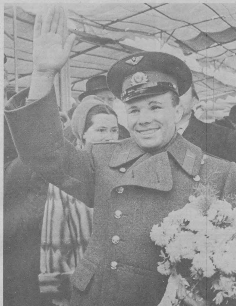
Этот снимок сделан 15 декабря 1961 года во время встречи первого в мире космонавта в Ташкентском аэропорту. Юрий Алексеевич Гагарин совершал поездку по Индии, Цейлону, Афганистану и по пути из Кабула в Москву был гостем столицы Узбекистана. Памятная встреча ташкентцев со знаменитым сыном нашей Родины началась здесь, у воздушных ворот Ташкента. А вечером в театре оперы и балета имени А. Навои состоялся митинг, оставшийся впечатлением праздника, когда бывало трудно удержать вразумительные радостные чувства. Восторженно приветствовали космонавта рабочий и колхозница, ученый и октябренки, студентка и летчик, товарищ по техникуму космонавт и поэт. И в раскатах стартового грома Краткое «Похожи...» звучит.