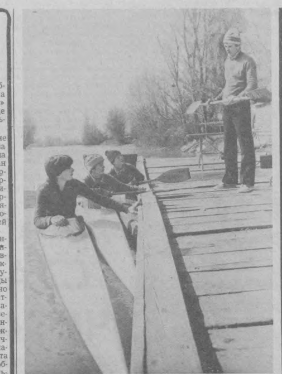
Свыше двухсот чирчических школьников и воспитанников Республиканского общеобразовательного интерната имени Титова провели школьные каникулы на гребном базах «Мехнат» и «Мехнат-2».

Заместитель редактора — 33-10-48, 33-72-77; ответственный секретарь — 33-24-88; секретарь — 33-34-75; ОТДЕЛЫ: писем трудящихся и массовой работы — 33-15-20; пропаганда марксистско-ленинской теории и коммунистического воспитания — 33-43-64; партийной жизни и местной печати — 33-41-47; советского строительства и быта — 33-14-75; промышленности, капитального строительства, транспорта, связи и торговли — 33-16-38; сельского хозяйства — 33-44-92; науки, школ и вузов — 32-57-13; внутренней информации, военно-спортивной — 33-81-29; литературы и искусства — 32-54-81; прием объявлений — 33-81-42.