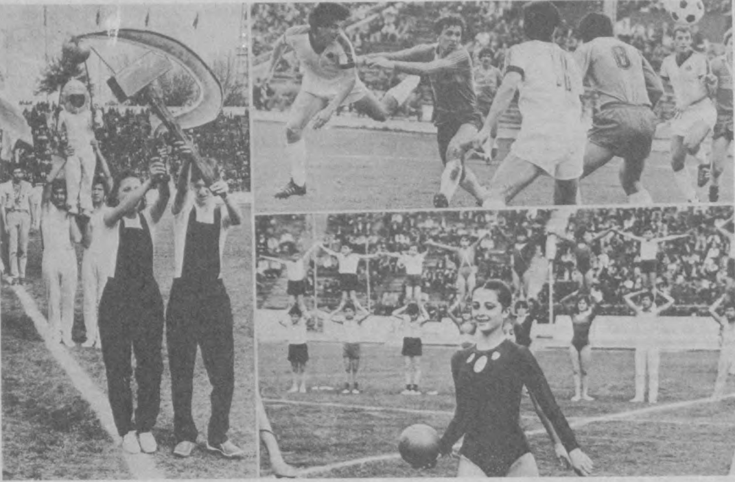
НА СНИМКЕ: спортивный праздник на Центральном стадионе «Пахтакор».