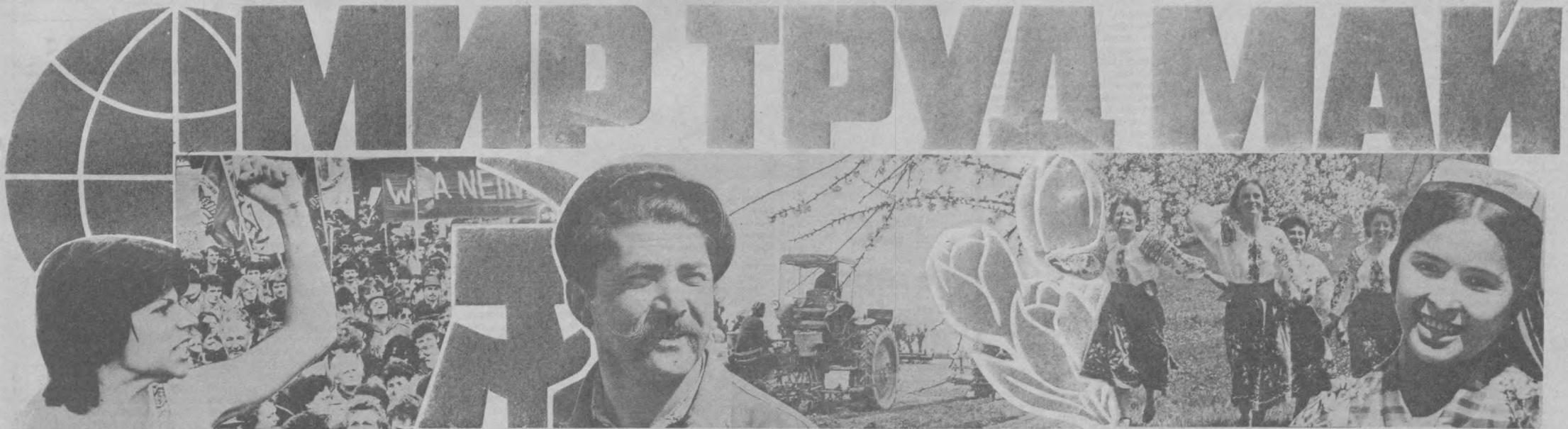
Плакаты В. МУРОМЦЕВА.