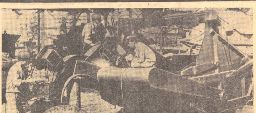
Вьетнам Демократик Республикаси машина-созлари 1975 йил план топшириқларини муддатдан илгари бажариш учун мусоабалани кучайтириб юбордилар. Ирригация министрлиги механизаторлар ишчилари 8 куб метр ҳажимдаги трактор сиреперлари ишлаб чиқаришни белгиланган муддатдан илгари ўзлаштириб олинди.