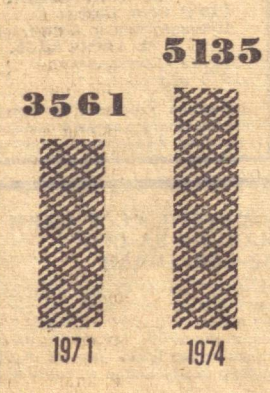
Пакта терши машиналари (доња ҳисобида).

1971—1975 йилларда умумий фойдаланишдаги қаттиқ қопламали автомобил йўллари тармоғи 5,5 миң километр узайтирилди.