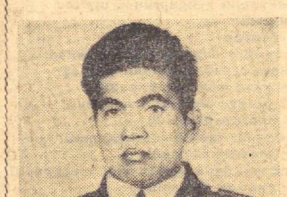
Бу воқеа Янгийўлда рўй берди. Ярим кечага яқин кўчалардан Биринчи ёрдам сўраган кичикерик эштилди...