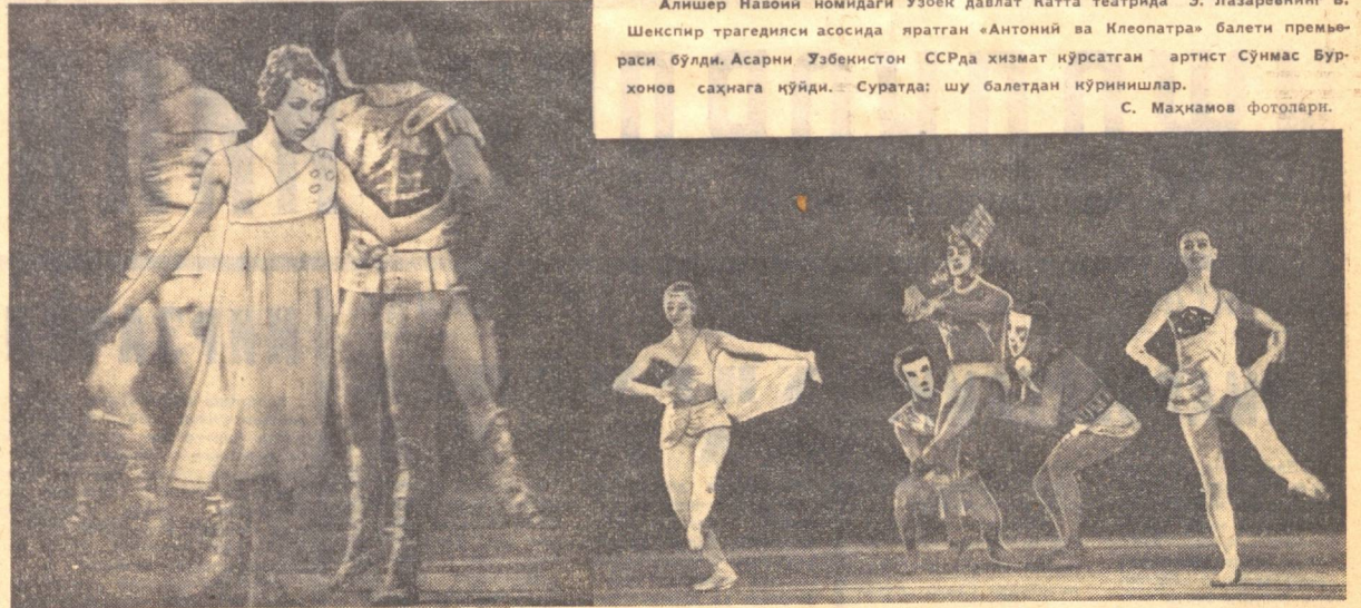
Алишер Навоий номидаги Ўзбек давлат Катта театрида Э. Лазаровнинг Б. Шенспир трагедияси асосида яратган «Антоний ва Клеопатра» балети премьераси бўлди...