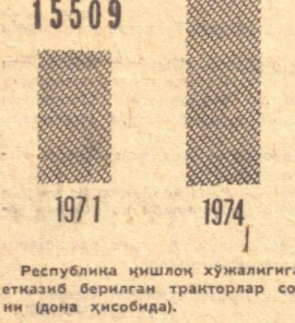
Республика кишлоқ хўжалигига етказиб берилган тракторлар сонини (доња ҳисобида).

Республикамизда минглаб кишилар тўққизинчи беш йиллик планини муддатидан илгари бажариш ташаббусига қўшилдилар.