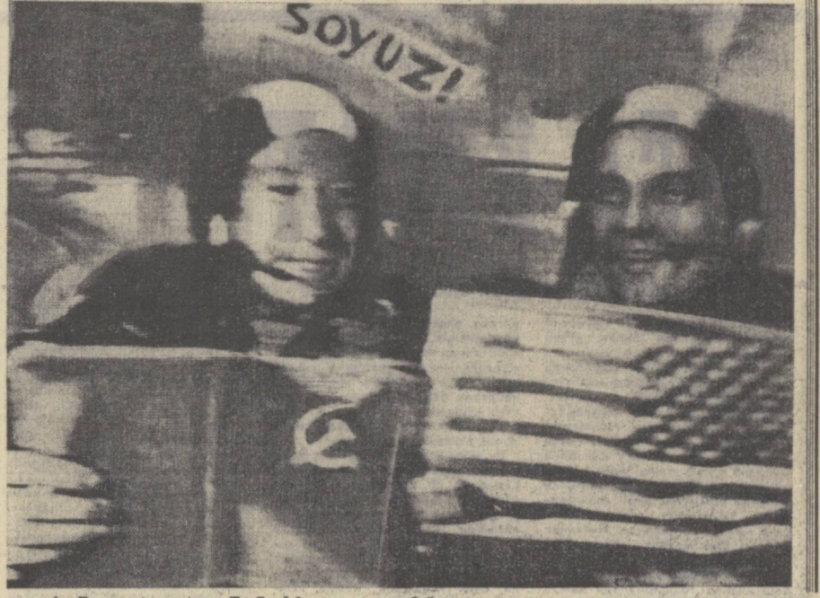
А. Леонов (чапда) ва Т. Стаффорд давлат байроқларини алмашишмоқда. (Сурет телеэкран орқали олинган).

Учун давомда совет «Союз» космик кемаси билан Американинг «Аполлон» космик кемаси биргаликда учиринида қатнашишда катта шарафга мувоҳаб бўлди. Ер юзюдаги барча халқларнинг тинчлиги ва тараққиёти учун муҳим бўлган бу космик парвозда ўртоқ Л. И. Брежневнинг олимлар, конструкторлар, ишчилар, космонавтлар меҳнатига берган юксак баҳоси ва самимий сўзлари бизни ихлоқлантириб турди.