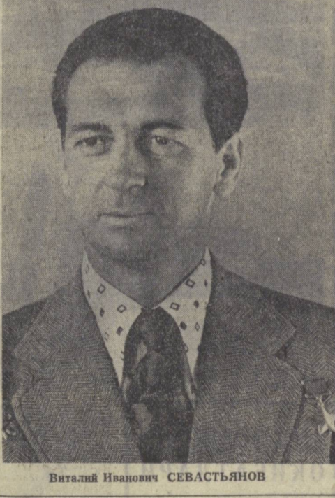
Виталий Иванович СЕВАСТЬЯНОВ