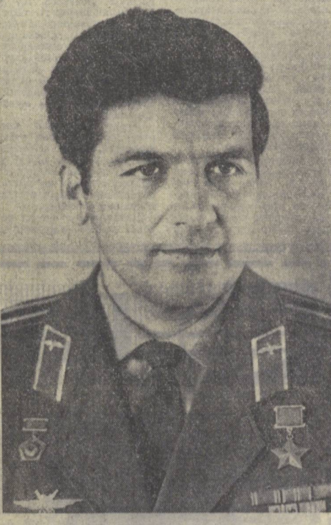
Петр Ильич КЛИМУК

Кенгашда Ўзбекистон ССР Министрлар Советининг Раисининг Н. Ж. Худойбердиев нунта қўниб олинди.