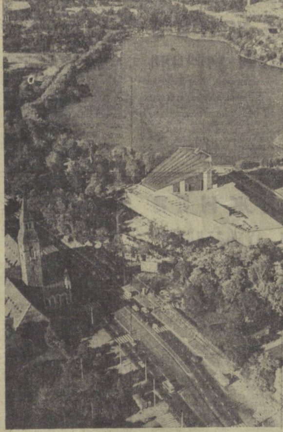
Кеча Финляндия пойтахти Хельсинки шаҳрида Европада хавф-сизлик ва ҳамкорликке бағишланган кенгашиш якунловчи босқичи бошланди. Бунда 35 мамлакатдан келган делегация қатнашмоқда. Су-ратда: Хельсинки шаҳарини кўришни.

Финляндия пойтахтига келиш-ди. Пойтахт аэропортида келув-чиларни Финляндия Республика-сининг Президенти У. К. Кекконен, бошқа расмий ки-шилар, шунингдек таъшиш мамлакатларининг дипломатия вакиллари кутиб олмоқдалар.