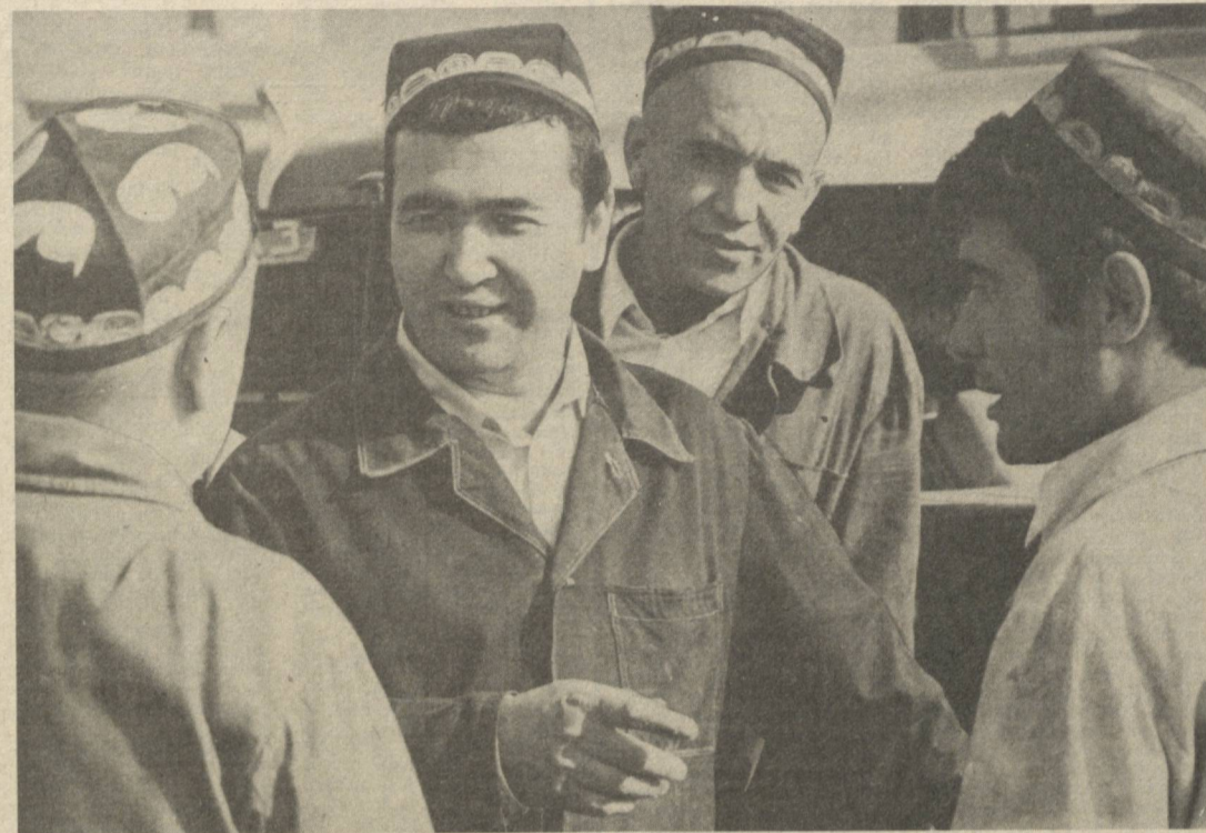
СССР ДАВЛАТ МУКОФОТИ ЛАУРЕАТЛАРИ

Везифа — партия, совет ва касба союз ташкилотлари иш вақтининг ҳар бир лаҳзаси қадр-қимматини ўлчашга олтиндан тароз, олмосдан тош оз эканлигини унутмасликлари, ишчи коллективларида беш йиллик топшириқларнинг ҳамма кўрсаткичлари бўйича ошириб бажарилиши учун социалистик мусобақани авж олдиришлари, резервлар ва имкониятларини тўла ишга солишлари лозим. Токи, ҳар бир меҳнаткаш бутун иш вақти мобайнида ўз қобилияти, маҳорати, истеъодид билан чинкам тер тўқис, бутун кечадиган, эртага бўғундиган баракали меҳнат қилсин. Кунлар, оёлар, йиллар ва беш йилликлар, ҳатто асрлар бонин вақтдан бошланади, унинг ҳар бир соати, ҳар бир лаҳзаси залворли беш йилликларимиз зямимизга бўйсин.