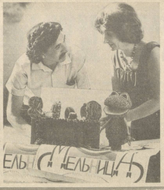
ЕЛЬ... ЕЛЬ... ИЦА...