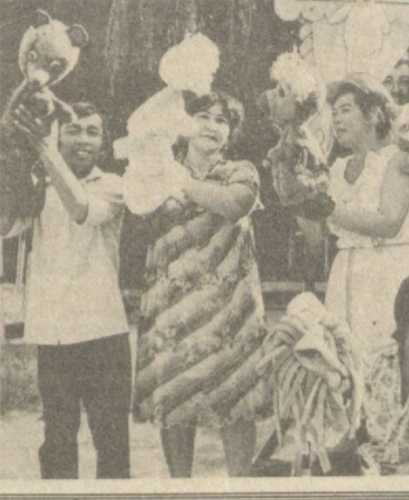
«Лопа» кўйирчоқ театри коллективини об-

Мана, беш йилдирки, Андижон области «Лопа» кўйирчоқ театри коллективини ўз асарлари билан ёш томошабинларнинг муҳаббатини қозониб келмоқда. Театр репертуридан ўрин олган спектакллар сони йилдан-йилга кўпайиб бормоқда.