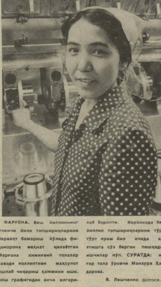
ШАРҲОНА. Беш йилликнинг учинчи йили тошпириларини барвақт бақариш йўлида Фирғона хиниявий толалар заводи коллективни маҳсулот ишлаб чиқариш ҳаммини ошириш графигини анча илгарилар борлиги.