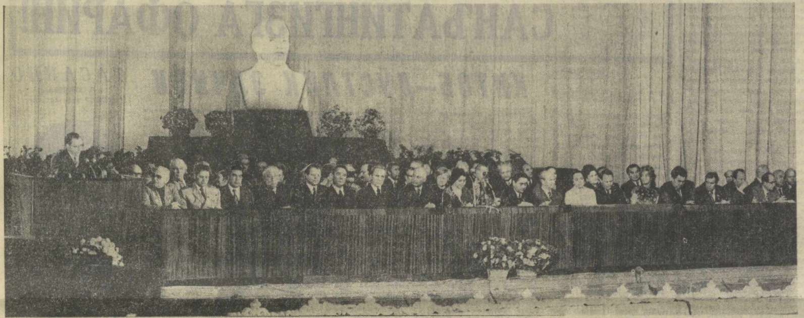
ТОШКЕНТ. 1976 йил 18 октябрь. Ўзбекистон ССРда РСФСР адабиёти ва санъати кунларининг ёпилишига бағишланган тантанали йиғилишнинг президиуми.

ЎЗБЕКИСТОН ССРга РСФСР АДАБИЁТИ ВА САНЪАТИ КУНЛАРИ ТАНТАНАЛИ ЙИГИЛИШИ