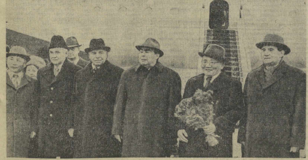
Суратда: аэродромда кутиб олиш пайти.

Л. И. Брежнев, Ю. Целенбал, Н. В. Подгорний, А. Н. Косигин, ўртоқлар, МХР Марказий Комитети Сийёсий бюросининг аъзоси, МХР Министрлар Советининг Раиси К. Батмунх, мотоциклларнинг фахрий эскорти ҳамроҳлигида Кремль томон йўл оладилар. Монголия Халқ Республикаси ва Совет Иттифонининг даълат байроқлари билан, монгол ва рус тилларида ёзилган табриқ транспарантлари билан безатилган аэропортда, пойтахт қўчалари ва майдонларда минг-миглаб москвалиқлар совет ва монгол раҳбарларини шод-хурамлиқ билан табриқлаб турдилар. (ТАСС).