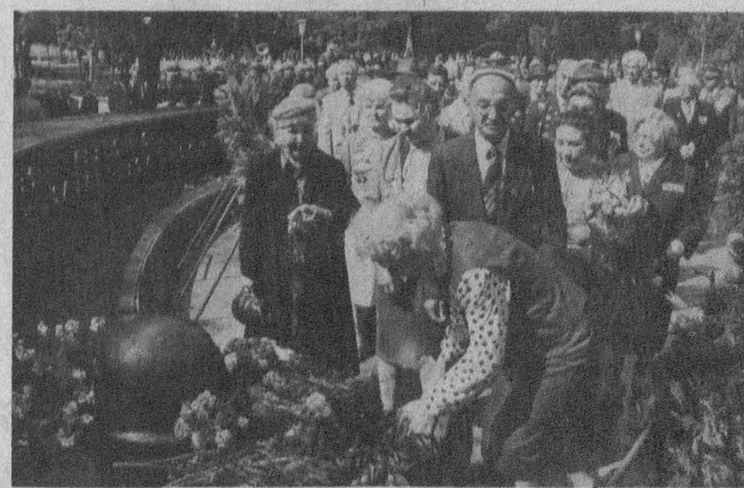
Суратларда Номаълум жаңгичи қабрга гулчамбарлар қўйиш пайти. Р. ЖУМАНИЗОВ (ЎЗА) суратлари.