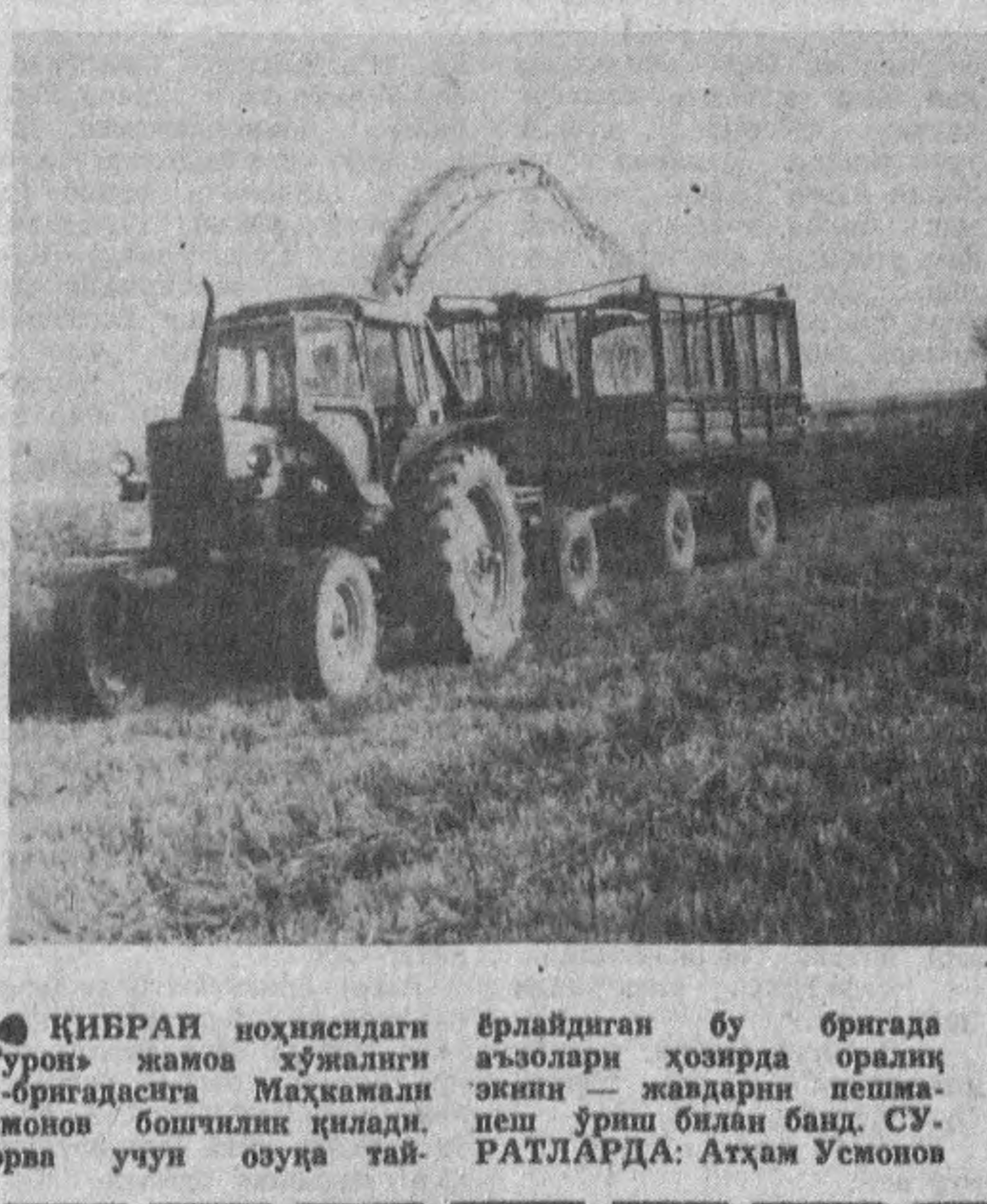
● ҚИВРАИ ноҳиясидаги «Турон» жамоа хўжалиғи 11-бригадасига Маҳмадали Усмонов бошлиқ қилди. Чорва учун озуқа тай-ёрлайдиган бу бригада аъзолари ҳозирда ораллиқ экин — жадарни пешла-пеш ўриш билан банд. СУРАТЛАРДА: АТХАМ Усмонов ва Шукрулло Аъзамов далада; (ўнгда) озуқани ўриб олаш қайти.