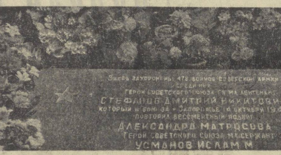
Суратларда: (юқорида) қардош Украинанинг Зопорожье шаҳридаги Каменик қишлоғида ҳалок бўлган Совет Иттифоқи қаҳрамони Ислом Усмонов ва унинг куролдош сафдошларига ўрнатилган ёдгорлик. Пастда: қаҳрамон қабрини зиёрат қилган борган ўзбекистонлик куролдошлар Ислом Усмоновга ўрнатилган ҳайнал ётганда.

ранналик биродарлар абадий-лаштиришга киришган эканлар. Уша қишлоғидаги 63-мактабга унинг номини беришга қарор қилинган. Мактабда «Ислом Усмонов бурчагини ташкил қилди». Қаҳрамонлар қабрини зиёрат қилиб, яна Тошкентга қайтдик. Ислом Усмоновнинг ҳолини ўзи туғилган ўган қишлоққа олиб келдик. Пўё, биз қардошлик нафасини, қардошлик юрагини олиб келдик. Улар мангу барҳаёт, улар қардошлар прагига қўйилганлар... Бола ХУДОЕРОВ, гвардия старший лейтенанти, Улу Ватан уруши қатнашчиси.