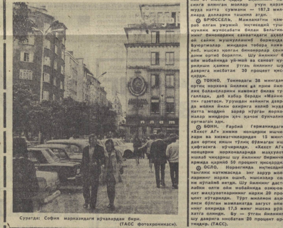
Суратда: София марназидаги кўчалардан бири.