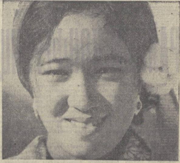
Хоразм области. Гурлан районидagi «Коммунизм» колхози пахтакорлари беш йилликнинг илмулочи йилида эл хирмонига 7 минг тонна «оқ олтин» тўқнаша аҳд қилишган.

Меҳнат Қизил Байроқ ордени «Гидромонтаж» трестининг прораблик участкаси коллективи Андижон сув омбори қурилишида қурилиш-монтаж ишлари беш йиллик планини муддатидан илгари бажариб, 1975 йил программасини тугаллади.