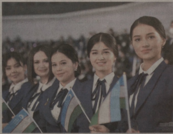
Именно молодежи принадлежит ведущая роль в реализации реформ в политических, экономических и социальных

Основополагающие реформы, произошедшие в жизни нашей республики за 30 лет независимости, прежде всего оказали огромное влияние на молодежь, ее жизненные позиции, ценностные ориентиры и социальные ожидания. Успех дальнейшего реформирования и модернизации страны зависит и от многомиллионного растущего поколения, в руках которого будущее государства.