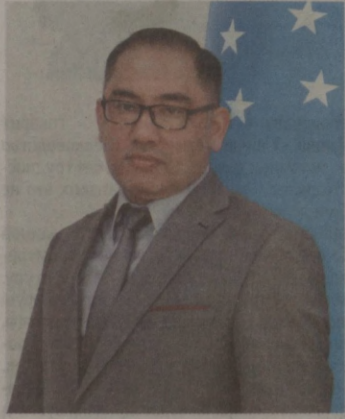
Шохрух Шарахметов. Председатель Антимонопольного комитета Республики Узбекистан.