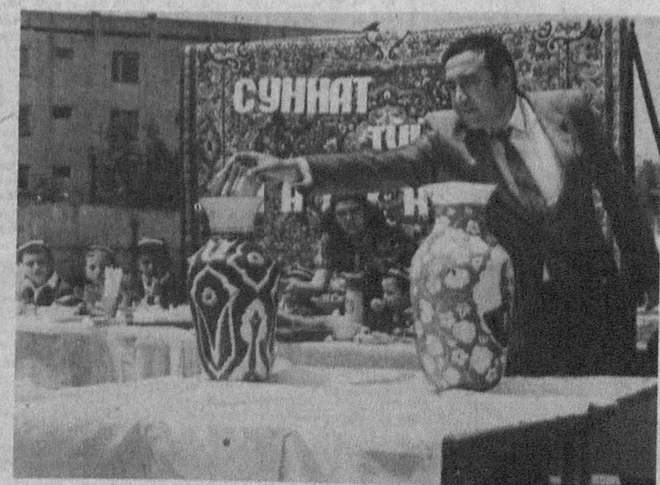
Суратларда: тантаналардан ливҳалар.