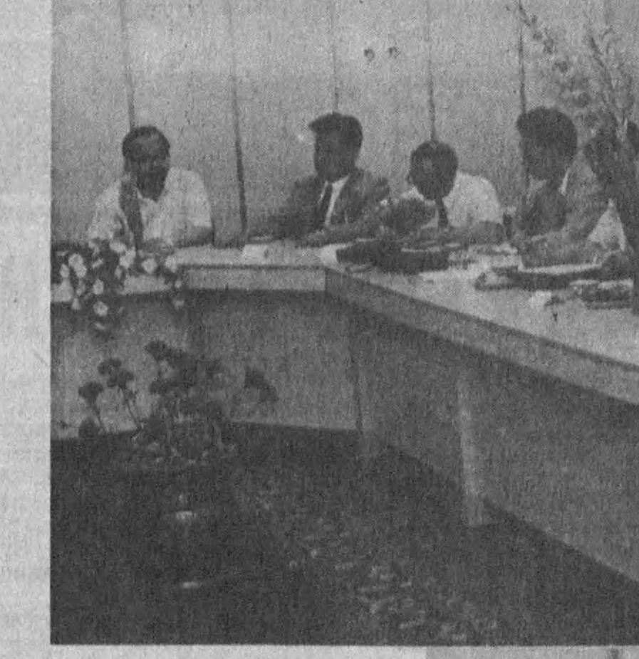
С. ҲАСАНОВ. Суратқаш В. ХАРИТОНОВ.