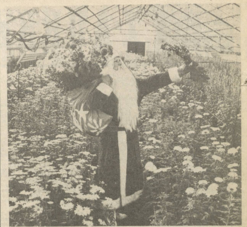
Янги йил байрамини республикамизнинг барча меҳнат ахли зўр қувонч...

«СОВЕТ ЎЗБЕКИСТОНИ» ГАЗЕТАСИ РЕДАКЦИОН КОЛЛЕГИЯСИ