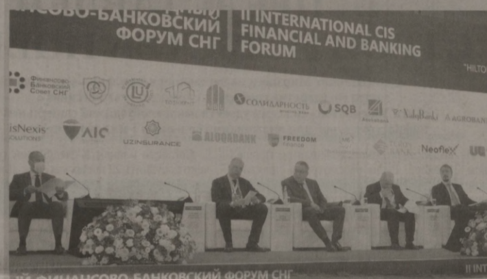
II INTERNATIONAL CIS FINANCIAL AND BANKING FORUM

страховой деятельности Узбекистана. Награда призвана объединить усилия профессиональных участников страхового рынка страны, направленные на его ускоренное развитие. В задачи премии входит также создание условий для формирования в стране современной страховой культуры, широкого привлечения СМИ, обеспечивающих активную информационную поддержку страховой отрасли и лучших достижений в данной области.