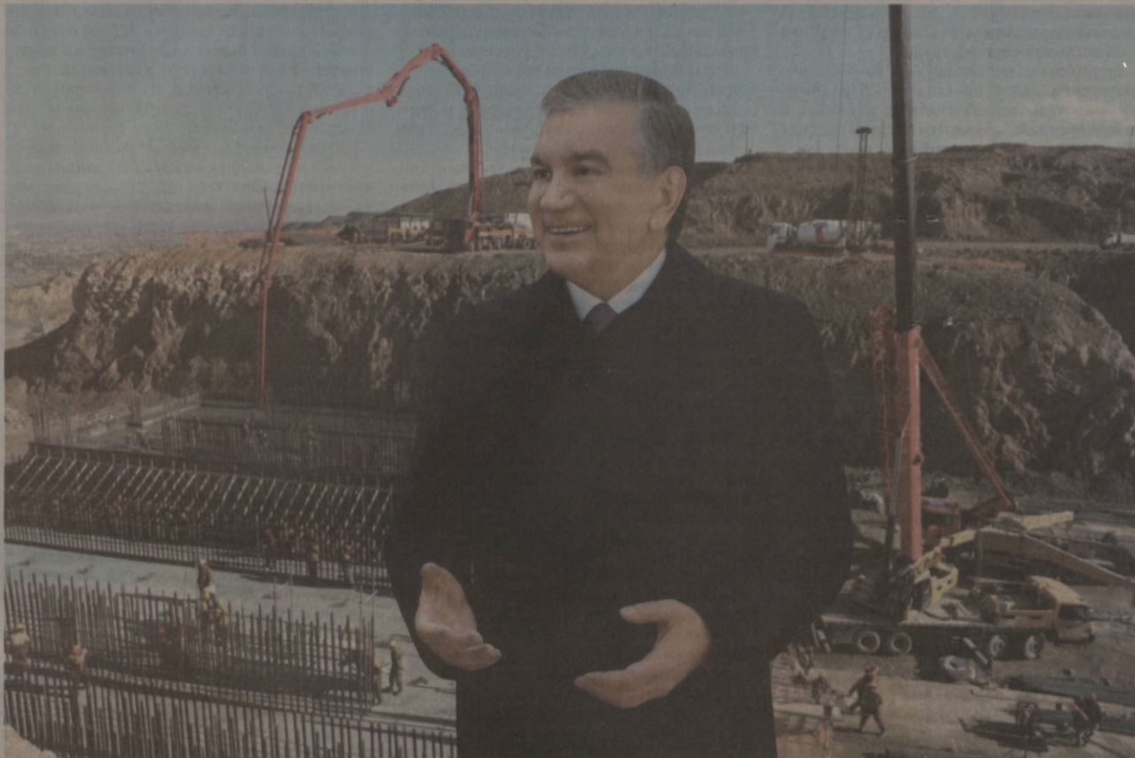
Президент Шавкат Мирзиёев 22 декабря в Алмалыке ознакомился с крупными промышленными проектами, провел диалог с населением.

В последние годы город активно развивается как в экономическом, так и социальном плане. Вводятся в строй новые предприятия, открываются медицинские и образовательные учреждения. Драйвером всех этих преобразований является Алмалыкский горно-металлургический комбинат.