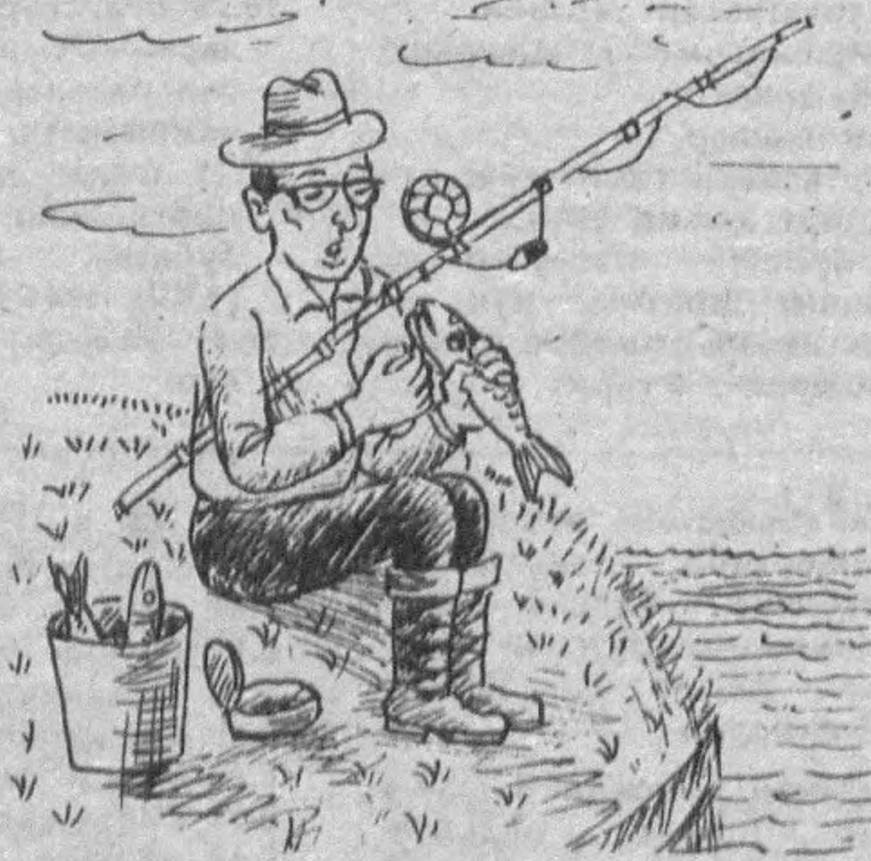
— А-а-а, деб юборгин, қармоғини тортиб оламан.