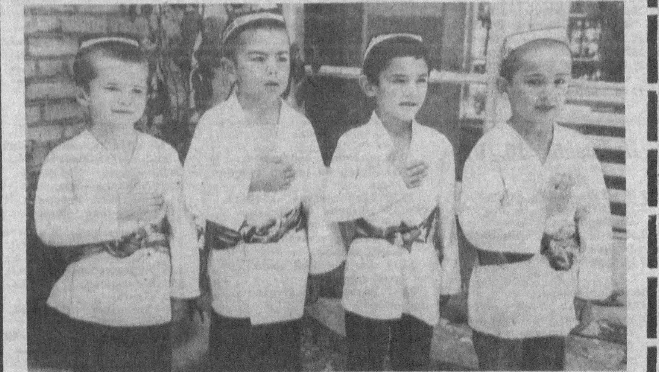
СУРАТЛАРДА: мазкур боғчадан олинган лавҳалар.