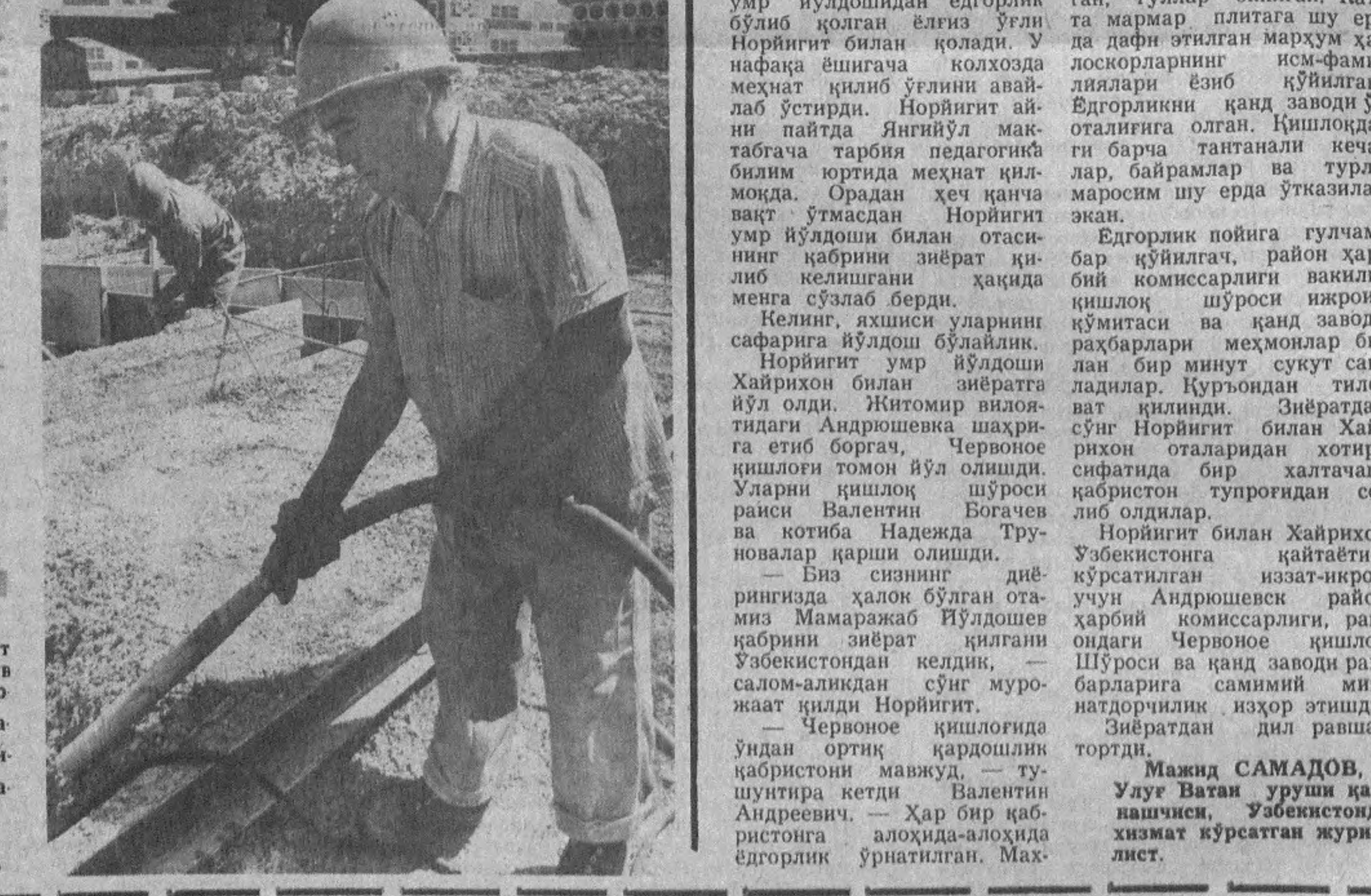
Ҳозирги вақтда эса айрим машина-механизмларнинг бўлиши, бунг майдончаларининг тартибга келтирилиши ва тўридан тўридан қўрилиши айрим-айрим ҳолларда кўриб боришимиз мумкин. Ҳамма гап бу ҳақиқатга қайта келишга қарайди.