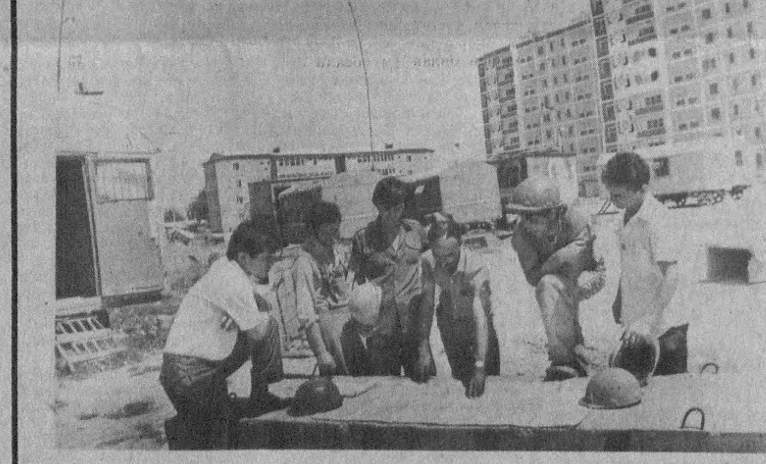
Ҳозирги вақтда виллоятимизда 251 минг 433 пенсионер ҳисобда турибди. Шу муносабат билан 14 минг 496 киши уруш қатнашчиларининг, 994 киши биринчи гуруҳ ногиронларининг, 4013 киши иккинчи гуруҳ ногиронларининг, 381 киши учинчи гуруҳ ногиронларининг ҳисобланади. Ҳозирги вақтда эса айрим машина-механизмларнинг бўлиши, бунг майдончаларининг тартибга келтирилиши ва тўридан тўридан қўрилиши айрим-айрим ҳолларда кўриб боришимиз мумкин. Ҳамма гап бу ҳақиқатга қайта келишга қарайди.

Собиқ «Вилма» жамоати Тошкент таълим-маърифий кўчаларидаги факультетнинг раҳбари, профессор И. А. Қўлиевнинг илмий-маърифий уюшмасига айланган эди. Оқимов билан, милодий қадриятларининг ҳақиқатга етказиш мақсадига эришиш учун илмий-маърифий уюшмасига айланган эди. Оқимов билан, милодий қадриятларининг ҳақиқатга етказиш мақсадига эришиш учун илмий-маърифий уюшмасига айланган эди.