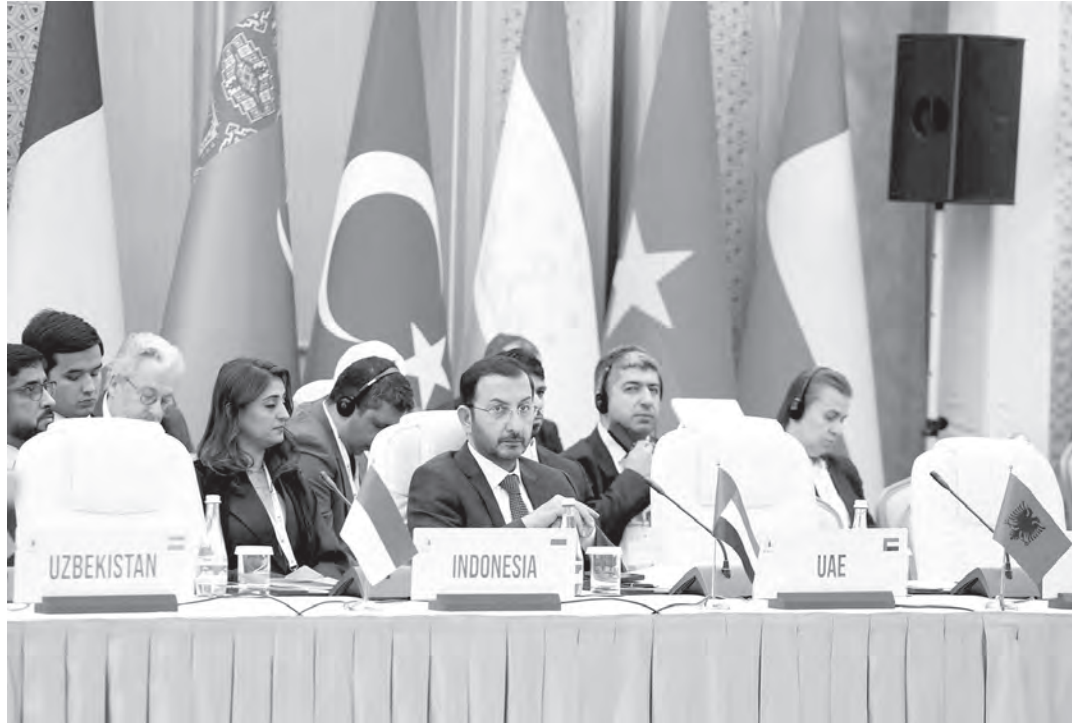
«Окончание. Начало на 1-й стр.»

В течение трех дней событие освещали более 50 представителей зарубежных и местных СМИ. Для них был организован пресс-тур в исторический комплекс «Улли-хавли», расположенный в Ургенчском районе Хорезмской области.