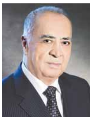
— Бахшичилик барча санъатларнинг онасидир, десам адашмайман.

Ўз ҳис-туйғуларини бир маромга солган шоирнинг ҳам, сўзларга мос куй яратган бастакорнинг ҳам, сўз ва оҳанг жўрлигида ўз орзу-умидларини қўйлаган хонанданинг ҳам, халқ қаҳрамонларини гавдалантиришга интилан актёрнинг ҳам илк вақили бахши бўлган, назаримда. Бахшичилик ана шундай қадимий, чўқур илдизларга эга санъат. Шу боис ҳам бахшиларни тингламаган, тинглай олмаган ашулани чинакам ашулани, у куйлаган достонлардан, термалардан тўрт қатор ёд билмаган шоирни чинакам шoir, дўмбира жарангидаги мазмунни хис қилмаган бастакорни бастакор, дейиш қийин. Бахшининг қалб оламини, руҳиятини англамаган, тушулмаган актёр ҳам ҳақиқий актёр бўлолмайд.