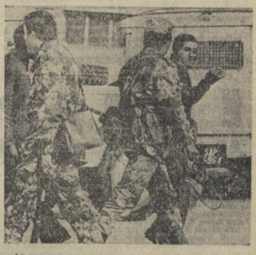
Африкаликларнинг ирчи режими қарши чиқилари бутун Суэзо шаҳри ва Трансваал вилоятини қамраб олиб, унинг иқудратли таъқини Жанубий Африка Республикаси бўлиб ёйилди. Кейтавқдаги кўнмиглаб африкаликларнинг норозилини намойишларига қарши ирчи режими кураш ишлатди. Суратда: намойиш катнашчилардан бири қамоққа олинимоқда.