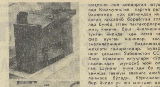
Булмаган ўтлоқларда ишлатиладиган У билан бир соатда чоррак гектарга ерми тозалаш мумкин. Машинанинг иқтисодий самараси бир йилда 1800 сўмин ташкил этади.

«Ўзглавмеханизация» бирлашмасининг давлат лойиҳалаш конструкторлик-технология бюросида яратилган ГР-0,5 чим қирққич машинаси маданий ва истироҳат боғлари, хиёбон ва спорт иншоотларидаги, йўл ҳаққисаги чимзорларда, шунингдек, унча катта