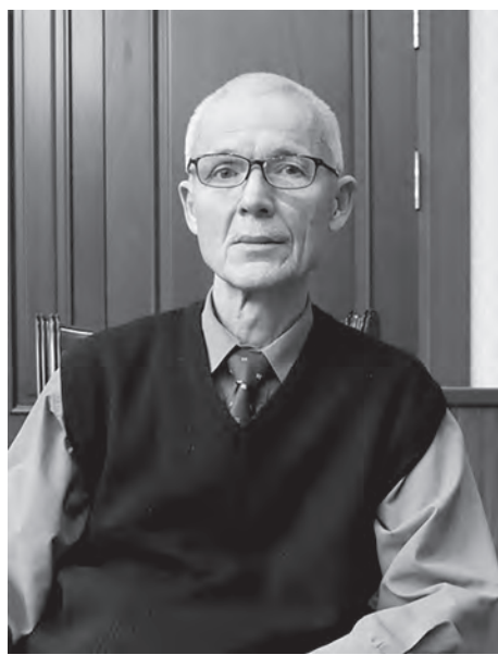
Юрий Кутбитдинов, главный научный сотрудник Центра экономических исследований и реформ при Административном Президенте Республики Узбекистан.