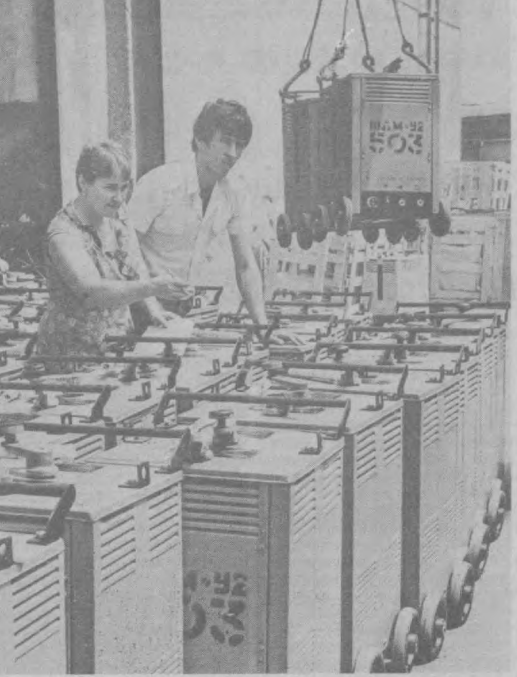
Более 38 тысяч электроварочных аппаратов изготовит в этом году завод «Ташэлектромаш».

Все в норме, Скважи- на «отвечает». Двигатель станка-качалки работает в заданном режиме, — кон-