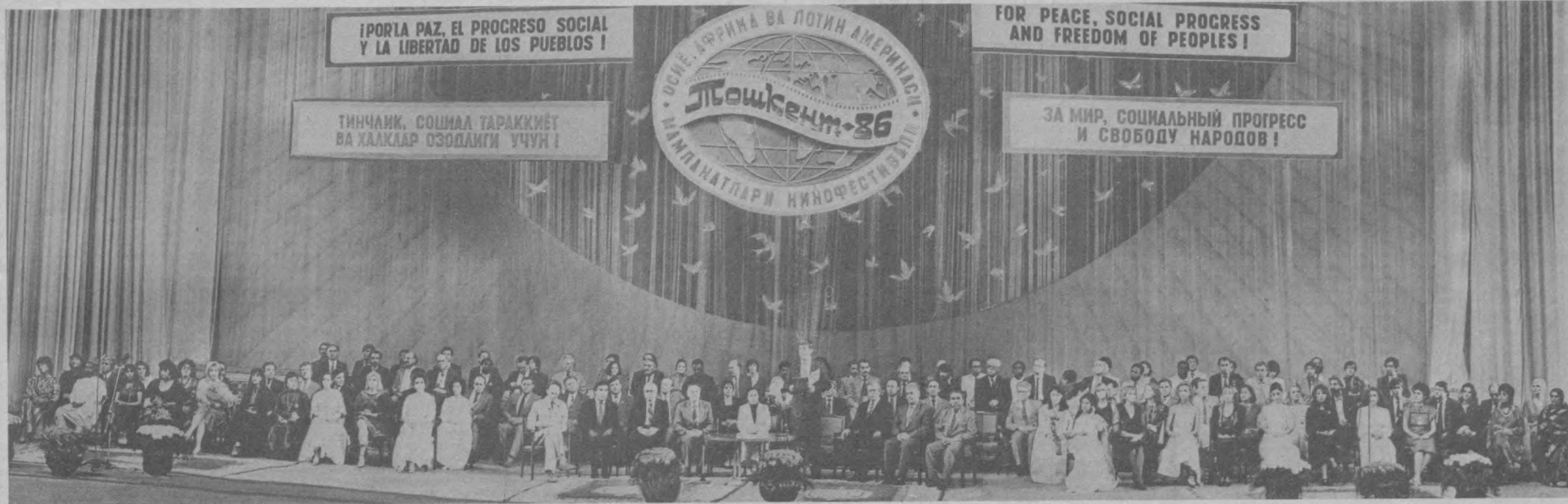
Ташкент. Торжественное открытие IX Международного кинофестиваля во Дворце дружбы народов.