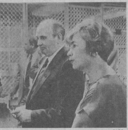
Во время посещения микрорайона Крылатское.