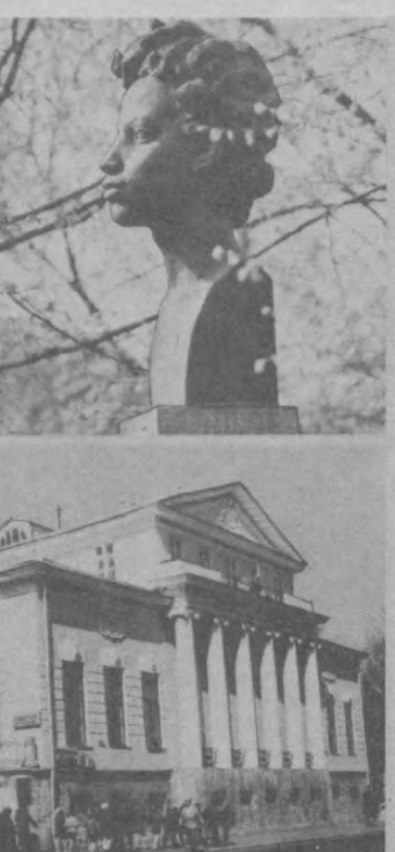
Пушкинская Москва, пушкинские места Ленинграда, Псковщины, Ирма, Кишинева и другие ежесюдно в иринеюские дни — дни, когда всюду прохладит пушкинские праздники...