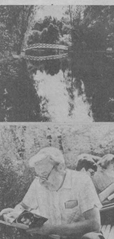
«Пруд под сенью на густых» в пушкинском Михайловском: Государственный музей А. С. Пушкина на Кропоткинском улице. Музей был открыт в день рождения великого поэта — 6 июня 1961 года...